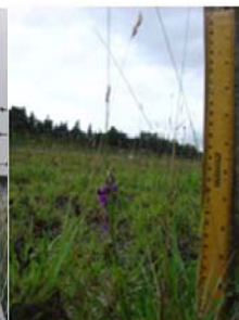
poda de pastos